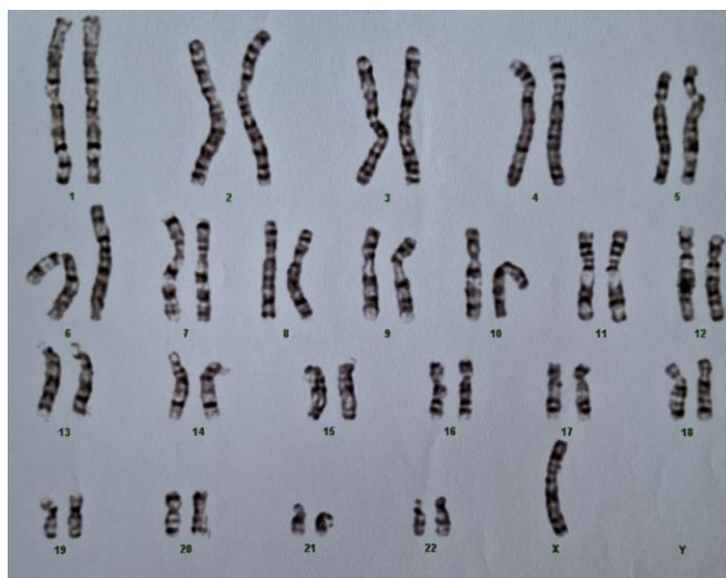
Slika 1. Kariogram – TS

Turnerov sindrom (TS) uzrokovan je djelomičnim ili potpunim nedostatkom drugog X kromosoma kod žene, što rezultira razvojem izrazito varijabilnog genotipa i kliničkog fenotipa (4). Jedina je monosomija koja je kompatibilna sa životom i javlja se kod otprilike 1 od 2000 novorođenih djevojčica (5). Kod žena s TS-om, X kromosom je u 60 % - 80 % slučajeva maternalnog podrijetla, a očinskog je podrijetla u 15 % - 35 % slučajeva, dok je u preostalim slučajevima uzrok nedostatka jednog X kromosoma, postzigotni gubitak X kromosoma (4). Približno 45 % pacijenata s TS-om ima tipičan kariotip 45,X, 15 % - 25 % ima mozaični oblik s kariotipom 45,X/46,XX, a otprilike 3 % ima kariotip 45,X/46,XY (6,7). Strukturne promjene na X kromosomu mogu se naći u 20 % slučajeva (7).