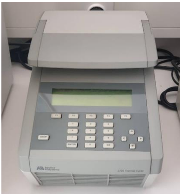
Slika 3. Uređaj za PCR 2720 Thermal Cycler, Applied Biosystems korišten u istraživanju (fotografija snimljena u Laboratoriju za medicinsku genetiku Medicinskog fakulteta u Osijeku, kolovoz 2019.)