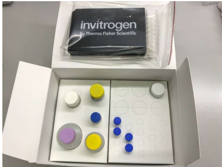
Slika 2. Sadržaj humanog ProcartaPlex™ kita

1 bocu univerzalnog pufera za ispitivanje, 1 bočicu razrjeđivača protutijela za detekciju, traku od 8 cijevi, magnetnu podlogu, te crnu ploču s ravnim dnom s 96 jažica (Slika 2. i 3.) (25).