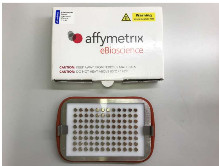
Slika 3. Magnetna podloga za crnu ploču s jažicama