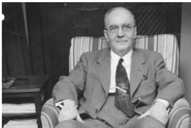
Slika 10: Lester S. Hill 11

poruka se nadopunjuje da bi se mogla podijeliti u blokove od po m slova. Bila je to prva praktična poligramska šifra koja je mogla šifrirati više od tri slova odjednom.