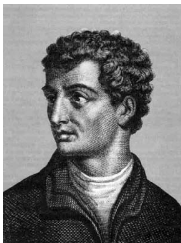
Slika 1: Leon Battista Alberti 1

Leon Battista Alberti, vanbračno dijete talijanskog plemića (nije poznato tko mu je majka), rođen je 1404. godine u Genovi. Razvio je metodu šifriranja koja je donijela revoluciju u područje kriptografije na zapadu. Albertijeva šifra, opisana u njegovoj raspravi o šifriranju De Cifris 1467. godine, prva je polialfabetna šifra. Raspravu je napisao za prijatelja Leonarda Datija ali ona nije bila tiskana u 15. stoljeću.