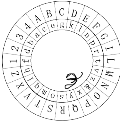
Slika 3: Albertijev disk za šifriranje postavljen tako da vrijedi preslikavanje T \mapsto m^3

Neka je indeksno slovo sa unutarnjeg diska primjerice slovo m . Uzme li se da za prvu riječ vrijedi preslikavanje T \mapsto m (prikazano na Slici 3), tada se prva riječ otvorenog teksta šifrira na sljedeći način: POLIALFABETSCA \mapsto Tx&trctncelmogc. Analogno se diskovi mogu okretati za sljedeće riječi kao posljedica biranja slova koja se preslikavaju u ranije odabrano indeksno slovo m iz unutarnjeg diska.