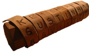
SLIKA 1. Skital