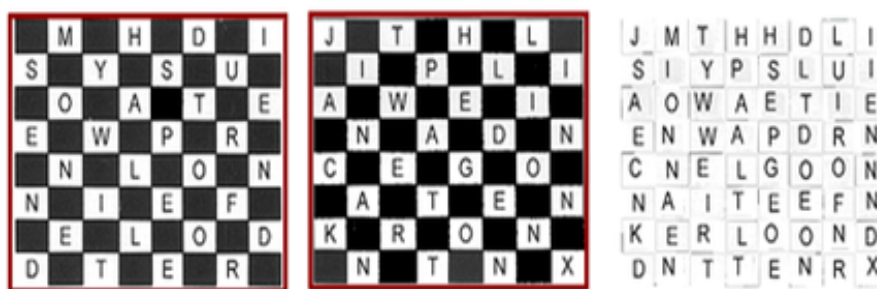
SLIKA 3. Šifriranje pomoću Trellis šifre

Ovaj oblik slanja skrivenih poruka koristili su Englezi u 16. stoljeću. Špijun kraljice Elizabete I, sir Francis Walsingham (1530–1590), koristio je rešetke u komunikaciji sa svojim agentima. Trellis , odnosno rešetke, predstavljaju oblik transpozicije u obliku šahovnice koji podsjeća na Rail-fence šifru. Primjerice, otvoreni tekst Send money with all speed to our friend Jack in Antwerp at the Golden Lion Inn x , pomoću trellis šifre šifriramo na sljedeći način: Slova najprije upisujemo u bijela polja na šahovnici (u slučaju da se slova otvorenog teksta upisuju okomito, šifrat se čita vodoravno i obrnuto.) Nakon što se ispune 32 polja, prelazi se na crna polja (u slučaju da poruka ima manje od 64 slova, prazna polja se ispunjuju znakom X ili nulom). U slučaju ako bude više od 64 slova, potreban je još jedan papir (još jedna šahovnica) (Slika 3).