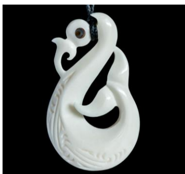
Slika 16.: privjesak Manaia