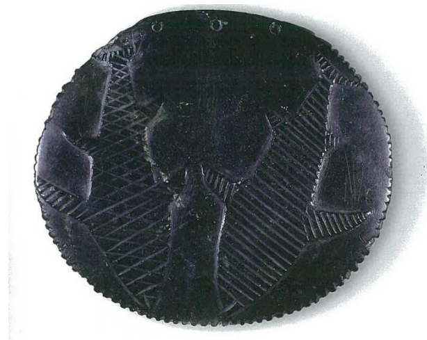
Slika 12.: disk s ribljim uzorkom iz Zaljeva Okains