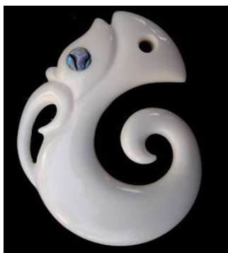
Slika 17.: privjesak Koropepe