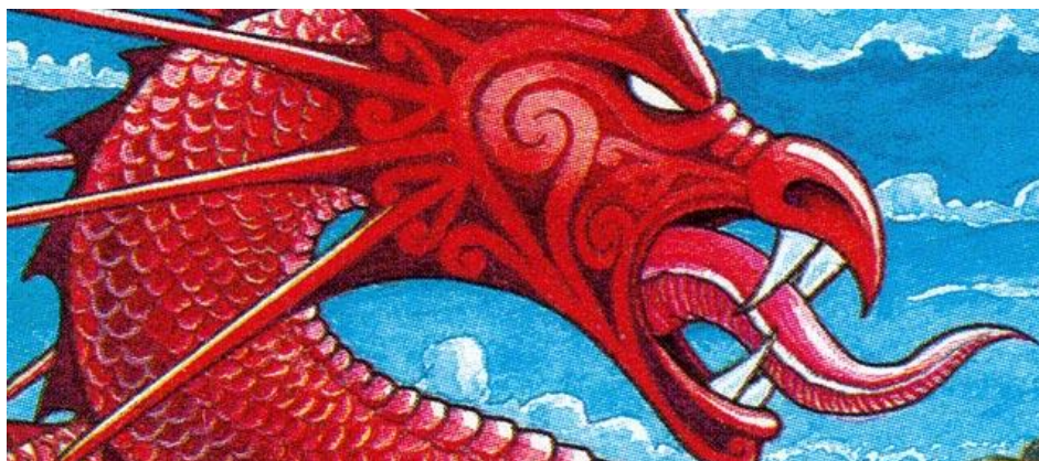
Slika 3.: taniwha