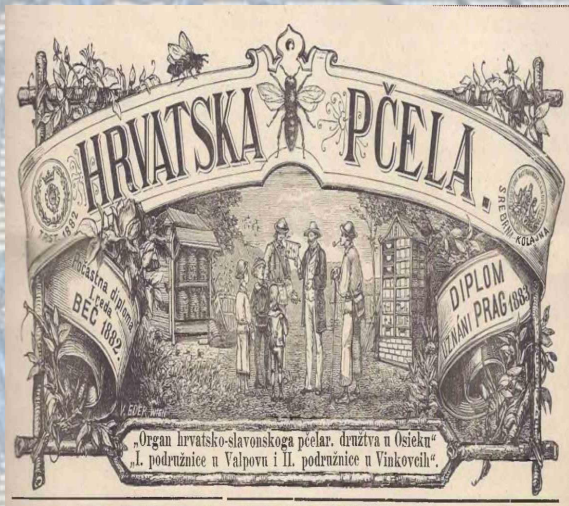
Ovom je družtu pokrvičelijem Pravitelj gospodin dr. TEDOR graf PEJAGEVIĆ, veliki župan županije viračičke.

Gradska i sveučilišna knjižnica Osijek posjeduje bogatu zavičajnu zbirku temeljenu na fondu Knjižnice Gradskog narodnog odbora Gornji grad (1947.) te fond Knjižnice Gradskog narodnog odbora Donji grad (1948.). Nužna je obrada, organizacija, zaštita i prezentacija tih zbirki.