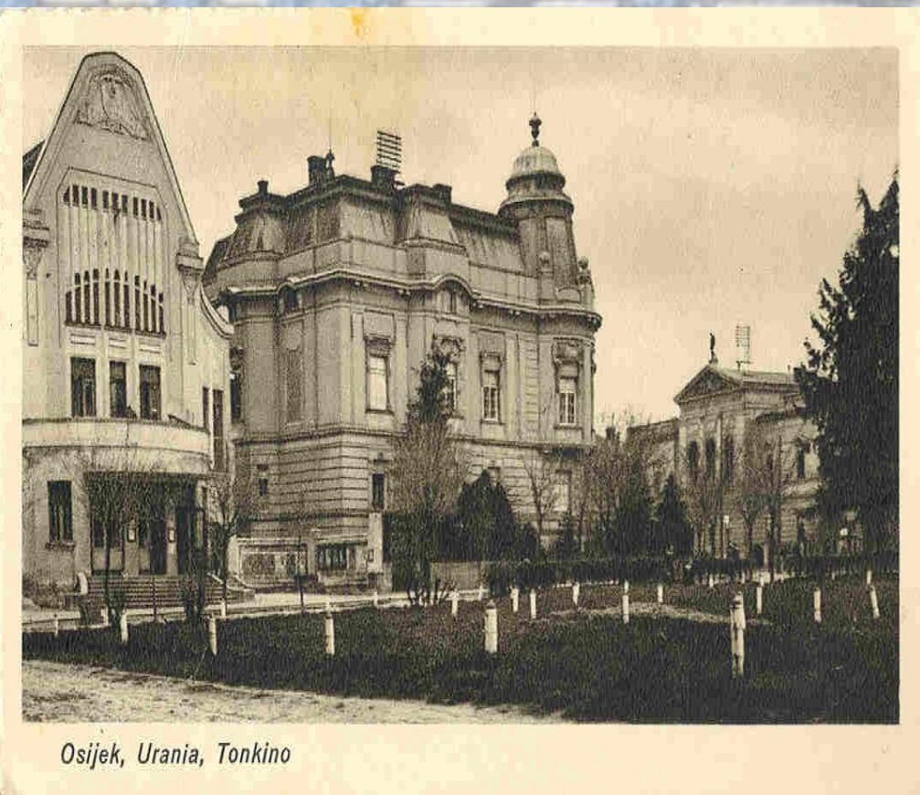
Osijek, Urania, Tonkino

Digitalizacija razglednica starog Osijeka započela je 2011. godine.