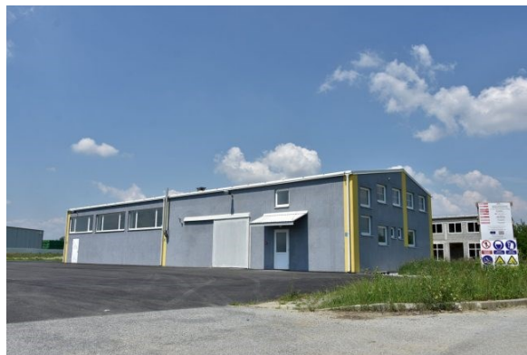
Slika 5. Proizvodna hala za preradu voća i povrća

Intenzitet potpore iznosi 50%, dok udio sufinanciranja 85% Europska unija, a 15% Republika Hrvatska. U ovom slučaju bilo je ulaganje u rekonstrukciju i opremanje postojeće proizvodne hale u proizvodnu halu za preradu voća i povrća. Proizvodnja prirodnog soka nakon dobivenih potpora krenula je samo ulaznim tokom i počinje biti prepoznatljiva kako u Virovitičko – podravskoj županiji, tako i u ostalim županijama lijepe naše. Pakiranjem sokova u bočice od 0,2 L, počinje veliki interes ugostitelja i hotelijera, a pakiranjem „bag in box“ od 3L, 5L, 10L i 20L velikih trgovačkih centara kao što je Kaufland Hrvatska. Bez potpore koju je omogućila Europska Unija i Republika Hrvatska, ništa od ovoga ne bi bilo moguće.