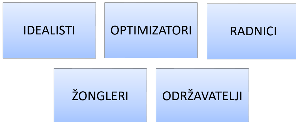
Slika 2. Tipovi poduzetnika