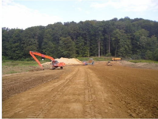
Slika 3. Radovi na izgradnji nasipa