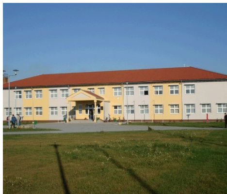
Slika 4. Strukovna škola u Virovitici