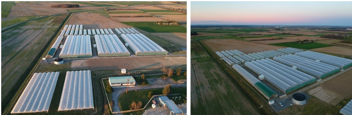
Slika 6. Plastenici tvrtke Brana d.o.o.

Poljoprivredni dio Brane d.o.o. hrabro se je odlučio i na izgradnju 30 plastenika ukupne površine 12.000 m 2 u kojima je planirana sadnja raznog povrća prema potrebama tržišta. U suradnji sa Vidrom, Agencijom za regionalni razvoj Virovitičko – podravske županije, aplicirana su dva projekta u EPFRR programu prema Mjeri 4.1.1. Rekonstruiranje, modernizacija i povećanje konkurentnosti poljoprivrednih gospodarstava. Prvi projekt je podizanje nasada jabuke ukupne površine 10 ha, a drugi izgradnja 20.000 m 2 moderno opremljenih plastenika za proizvodnju povrća. Dobivenim mjerama Brana d.o.o. otvorila je mogućnost zapošljavanja mnogo radne snage te tako doprinijela smanjenju nezaposlenosti u županiji. Također, poticajem za zapošljavanjem na neodređeno, mladih ispod navršениh 30 godina života, država omogućuje poslodavcu oslobađanje od plaćanja doprinosa na plaću u razdoblju od 5 godina što je također utjecalo na smanjenje nezaposlenosti i „vjetar u leđa“ kako Brani, tako i drugim tvrtkama da sve više zapošljavaju mlade ljude.