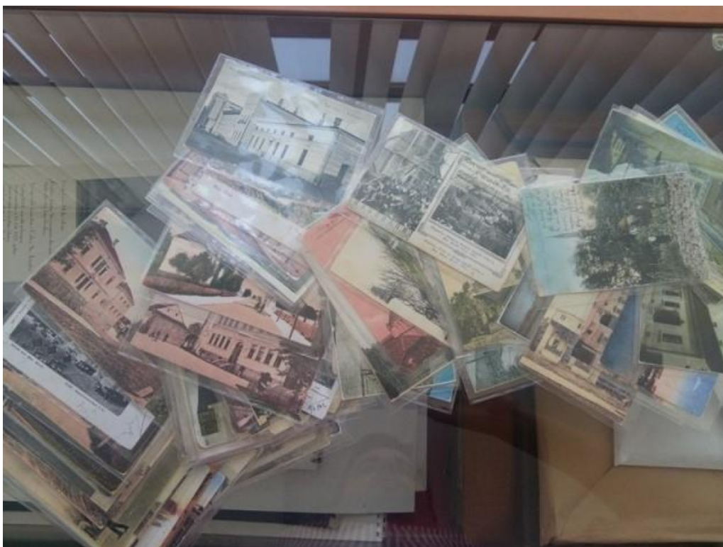
Slika 2. - Razglednice prije skeniranja

Priprema građe uključuje proces zaštite koji se primjenjuje za staru tiskanu građu. To podrazumijeva da će svaka jedinica građe prije samog snimanja biti očišćena, a kiselost papira neutralizirana te zaštićena.