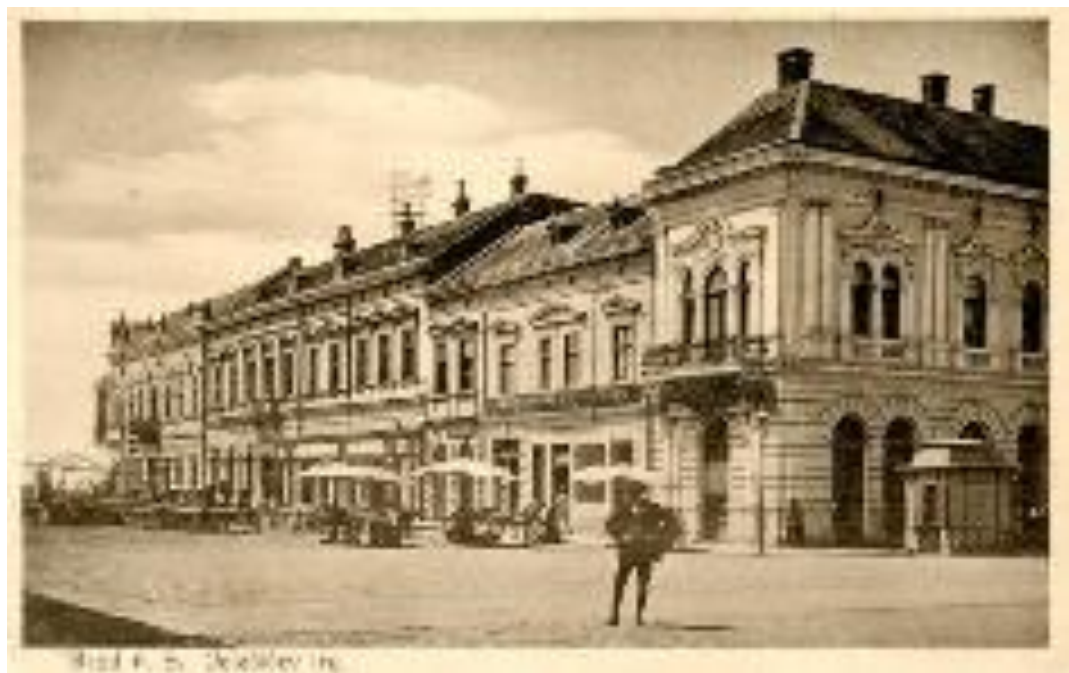
Slika 4. - Primjer skenirane razglednice.

Sadržaj zbirke dostupan je svim kategorijama korisnika kroz zasebno mrežno mjesto (engl. web site ) u sklopu postojećih mrežnih stranica Gradske knjižnice Slavonki Brod