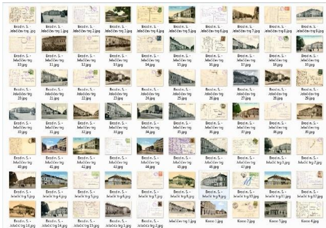
Slika 3. - Razglednice nakon skeniranja.