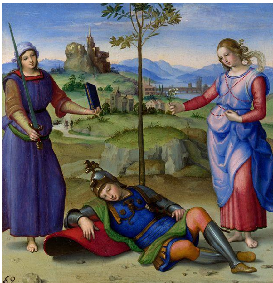
Prilog 1. Rafael, slika Vitezov san

okružen je dvjema ženama. Jedna žena u rukama drži knjigu i mač, a druga cvijet. Pejzaž u zadnjem planu slike predstavlja talijanski grad na istoku, Urbino. Postoji nekoliko teorija tumačenja ove slike. Neki povjesničari umjetnosti smatraju kako ona prikazuje uspavanog kralja koji je zapravo rimski general Scipion Afrički (236.-184. Pr. Kr.). On je zaspao ispod drveta i u snu je vidio dvije žene, Vrlinu i njezinu suparnicu Užitak. Vrlinu predstavlja žena s kraljeve lijeve strane. Jednostavnije je odjevena, ima mušku figuru i kosu. Ona obećava Scipionu duboko poštovanje i slavu pobjede u ratu, no upozorava kako je taj put prema njezinom samostanu na vrhu brijega kamenit i težak. Užitak, s mirisnim i glatkim loknama te tamnim očima, predlaže lak i bezbrižan život. Kralj u svojem snu mora odlučiti između dvije vrijednosti. Sugerira se kako je put Istine puno teži, ali donosi više toga. Također, žene mogu predstavljati kraljeve idealne atribute - knjigu, mač i cvijet. To jesu simboli koji predstavljaju ideale intelektualca, vojnika i ljubavnika koje idealni kralj mora posjedovati. Smatra se kako je alegorija preuzeta iz poeme „Punica“ koja tematizira Drugi punski rat, latinskog pjesnika Siliusa Italicusa. (Toman, 2005: 335)