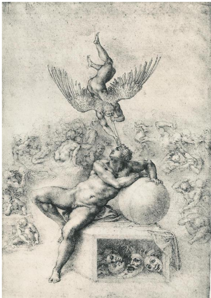
Prilog 2. Michelangelo, slika San ljudske taštine

Druga slika je San ljudske taštine ili The Dream of Human's Life . Autor slike je Michelangelo Buonarroti. Nastala je 1533. godine. Ona je Michelangelov ikonografski crtež. Tradicionalno se tumači kao alegorija vrline i poroka, odnosno moralne poduke. Alegorija predstavlja borbu između intelekta i strasti ili proslavu pročišćavanja snage ljubavi. Nag mladić spava s glavom naslonjenom na globus, napada ga anđeo s krilima, svirajući trubu. Ispod globusa nalazi se kolekcija maski - moguće da prikazuju iluzije ili snove - dok je mladić okružen skupinom koja moguće da prikazuje sedam smrtnih grijeha. Jasno se vidi pet poroka, a to su proždrljivost, putenost, pohlepa, lijenost i gnjev. Ostala dva grijeha, zavist i ponos, slabo se može identificirati. Ljepušasti mladić pozvan je trubom kako bi napustio svoj život poroka te se ugledao u nebo za svoje spasenje. (Toman, 2005:439)