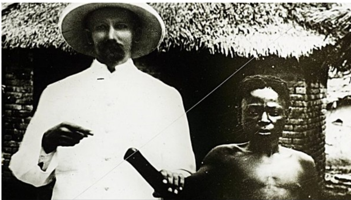
Slika 2. Fotografija osakaćenog Kongoanca.