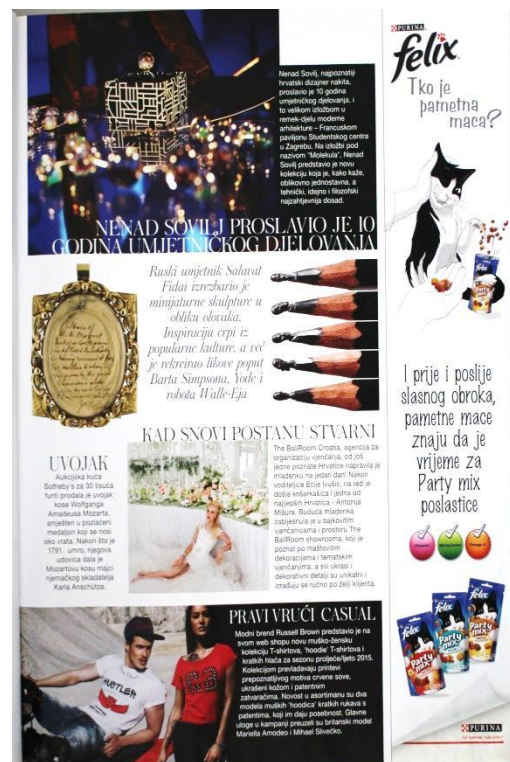
Slika 10: Isto (SB: 27)

Časopisi omogućuju prijenos novih informacija koje nisu prisutne u televizijskoj reklami i tako pružaju novu percepciju televizijskih reklama. (Consterdine, 2005: 7) Ako se vratimo na jednostavan model oglašavanja (dijagram 1), možemo vidjeti kako oglašavanje u dva ili više medija