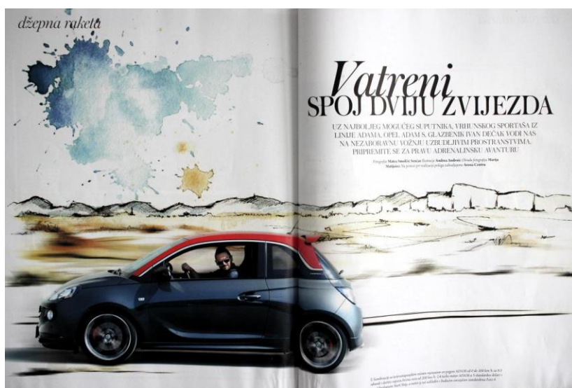
Slika 3: Reklama za Opel Adama (SB: 268)

Jezični elementi jesu primarno, često i jedino sredstvo reklamnoga izraza, no oni ponekad smisao tvore tek sa svojom vezom s parajezičnim kodom reklame, odnosno našim razumijevanjem subtekstualne podloge i ideoloških vrijednosti na čijim osnovama su građene.