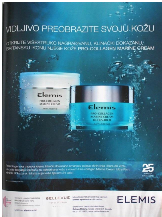
Slika 5: Reklama za Elemis (SB: 166)

U reklamama u ženskim časopisima često je intermedijalno ispreplitanje slike i teksta. Reklame za kozmetičke proizvode, kojih je uz modne proizvode najviše, najčešće su informativnog tipa, gdje uz sliku idealizirane žene i proizvoda donose brojne informacije o proizvodu koji se reklamira, naravno, ističući sve njegove prednosti u odnosu na druge proizvode. Iznosene informacije često su nadopunjene gotovo znanstvenim podacima te u njima možemo pronaći znanstveni stil u reklamnom podstilu ženskih časopisa.