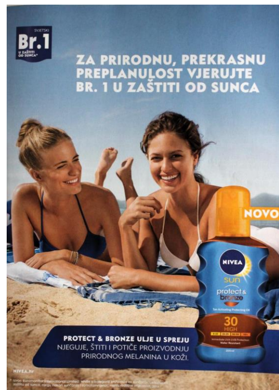
Slika 6: Reklama za Niveu (SB: 49)

Iz priložene reklame vidimo da su informacije o poduzetim istraživanjima ili samoprocjenama napisane sitnim i teško čitljivim slovima, ali su zato informacije dobivene istraživanjem značajno istaknute u postocima ili zaključcima poput onih iznesenih u znanstvenom radu. Kao u prethodnom primjeru, u mnogim reklamama kozmetičkih proizvoda koje donose objavu nekog istraživanja česta je upotreba zvjezdice (*), koji donosi neku obavijest o tome kako je istraživanje, čiji su rezultati uvijek istaknuti, provedeno. Obje su reklame zasićene tekstem i informacijama koje su nepregledne, a navodi o tome kako je provedeno istraživanje ili odakle su izvučeni podatci na koje se reklama referira služe ograđivanju samog subjekta od mogućih tužbi