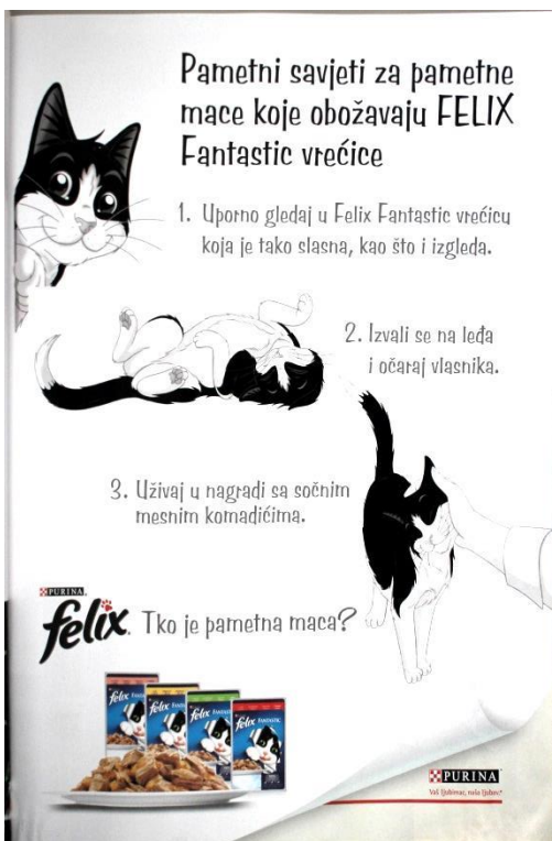
Slika 9: Reklama za Felix hranu za mačke (SB: 25)

Reklama za hranu za mačke FELIX Fantastic (SB: 25) sloganom Tko je pametna maca? nadovezuje se na televizijsku reklamu istog proizvoda, ali i progovara u perspektivi obraćanja mački, Izvali se na leđa i očaraj vlasnika; Uživaj u nagradi sa sočnim mesnim komadićima . Takva vrsta međusobne komunikacije dvaju medija pozitivno utječe na sliku reklame i postiže veću zapaženost.