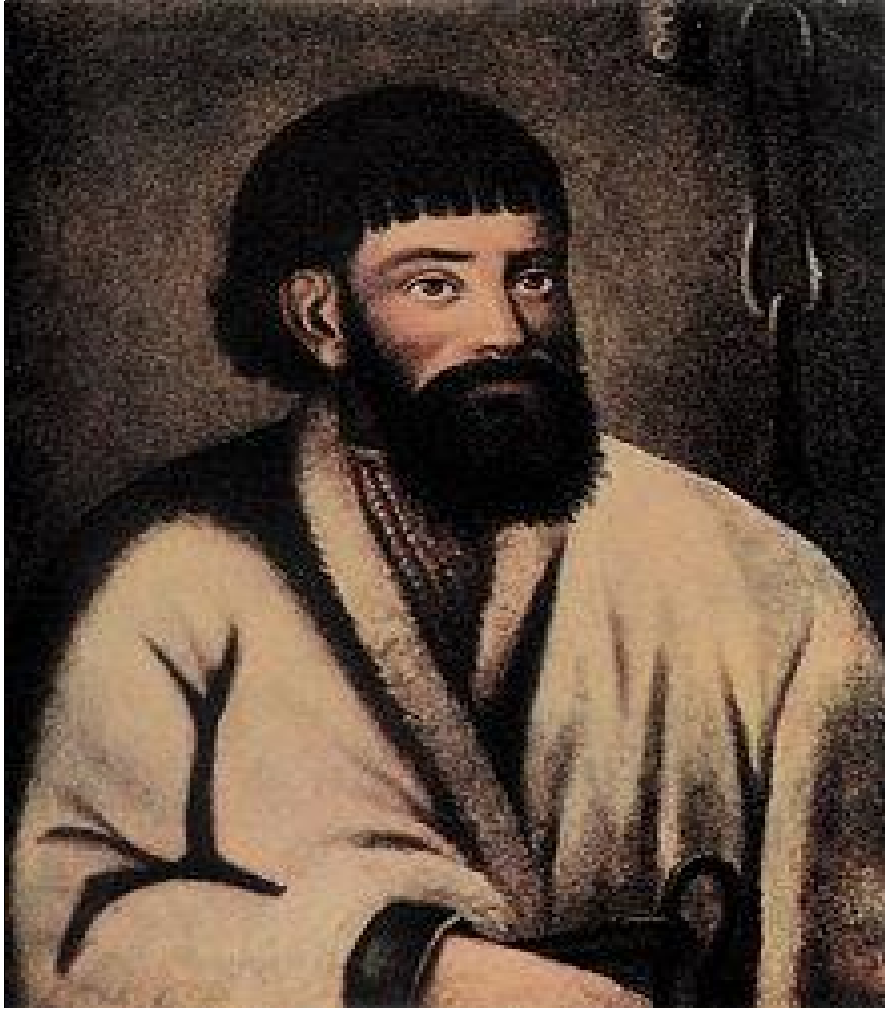
Prilog 4. Jemeljan Pugačov