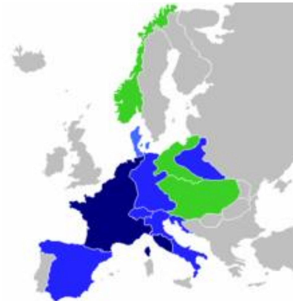
Prilog 3: Francusko Carstvo za vrijeme Napoleona Bonaparte (tamno plava – Francusko Carstvo, svjetlo plava – francuske „satelitske“ države, zelena – države s kojima je Francuska bila u savezničkim odnosima)