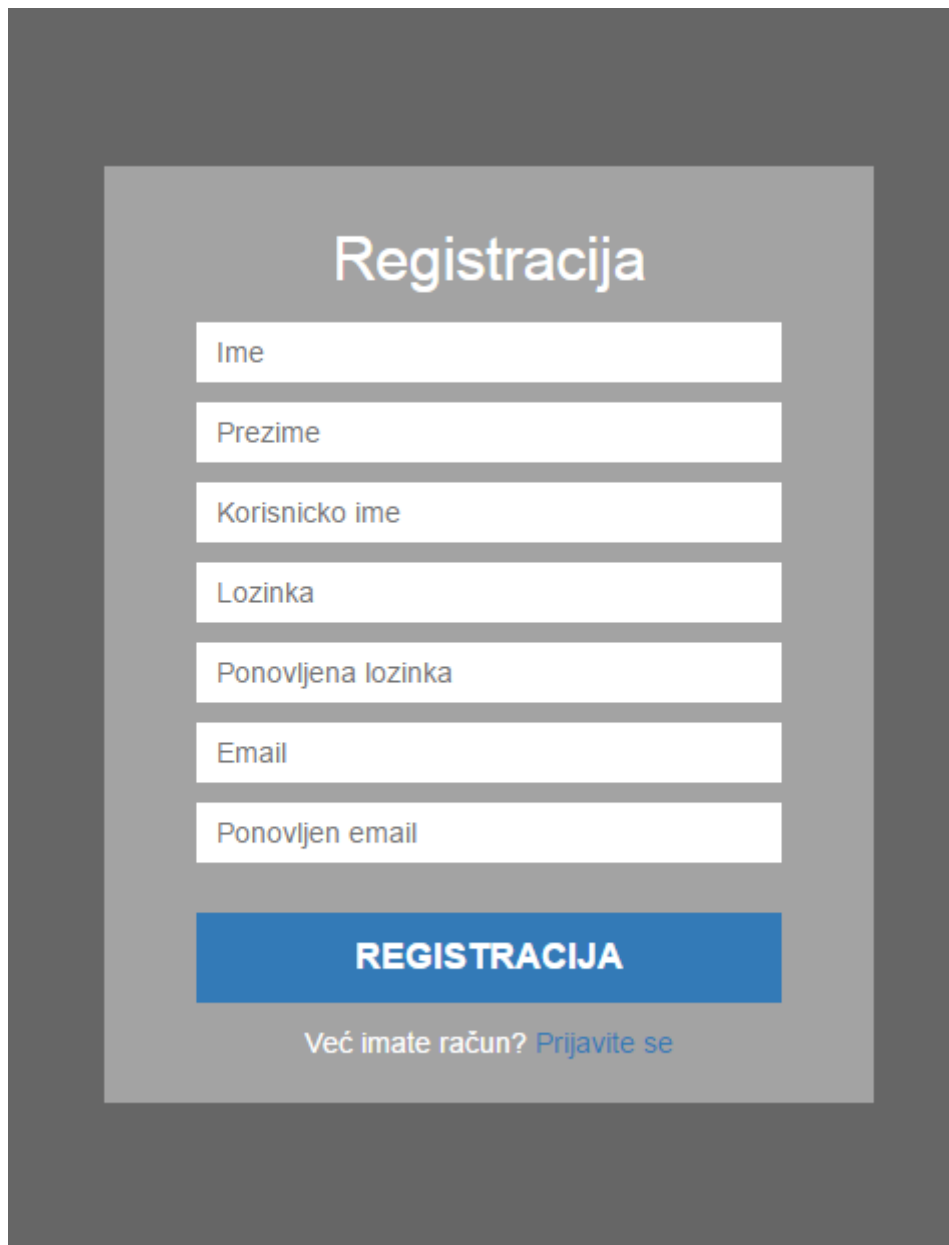
Sl. 4.2 Obrazac za registraciju

Registracija u sustav vrši se preko obrasca napisane u HTML-u, a preko "POST" metode šalju se podaci u bazu podataka, a kao akcija, preko koje će se poslati ti podaci, postavlja se na ime skripte koja je napisana za registraciju.