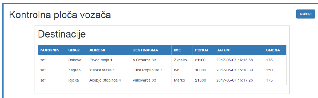
Sl. 4.12. Kontrolna ploča vozača

Pritiskom na „destinacije“ otvara se tablica gdje vozač ima pregled svih narudžbi koje su zatražene od strane registriranih korisnika. U tablici su navedeni samo najbitniji atributi koji su važni vozaču za njegovu dostavu naručenog paketa. Pritiskom na gumb „natrag“ vraća se na početnu stranicu vozača. Tablica destinacija prikazana je na slici 4.12.