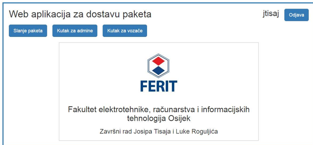
Sl. 4.1 Početna stranica

Naslovna stranica aplikacije napisana je u HTML-u, a korišten je Bootstrap za responzivni dizajn. Vidimo da ima prijava i registracija, ali njih ćemo u idućim poglavljima objasniti. „Slanje paketa“ služi prijavljenom korisniku da naruči slanje paketa na destinaciju koju on želi. „Kutak za admina“ služi da se administratori aplikacije logiraju i onda se vidi cijela povijest naručivanja svih registriranih korisnika. „Kutak za vozače“ služi da vozač koji dobije narudžbu vidi gdje ta narudžba mora biti dostavljena. Prikazano na slici 4.1.