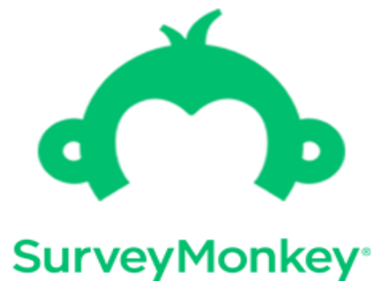
Slika 2. Logo Survey Monkey-a (InsightPlatforms, 2018)

Uz zgradu sjedišta od 200.000 četvornih stopa u San Mateu u Kaliforniji, SurveyMonkey ima urede u Portlandu, Seattleu, Dublinu, Ottawi, Londonu i Sydneyu. Od 2022. SurveyMonkey je zapošljavao oko 1400 ljudi.