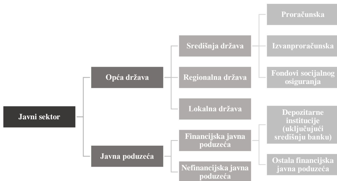
Slika 1. Javni sektor prema MMF-u

Iz prikazane slike moguće je iščitati da se javni sektor može podijeliti na opću državu i javna poduzeća. Opća država se zatim dijeli na središnju državu, regionalnu državu i lokalnu državu. Središnja država se dalje razdvaja na tri sastavnice: proračunsku, izvanproračunsku te fondove socijalnog osiguranja. Javna poduzeća mogu se podijeliti na financijska i nefinancijska javna poduzeća. Financijska javna poduzeća mogu se podijeliti na depozitarne institucije u koje je uključena i središnja banka te na ostala financijska javna poduzeća.