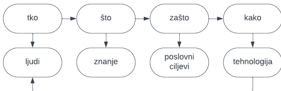
Slika 1. Komponente upravljanja znanjem, Izrada autora prema Bahtijarević-Šiber (2014)

Ulogu tehnologije u upravljanju znanjem prikazuje slijedeća slika.