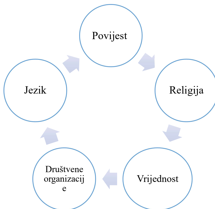
Slika 1 Elementi kulture