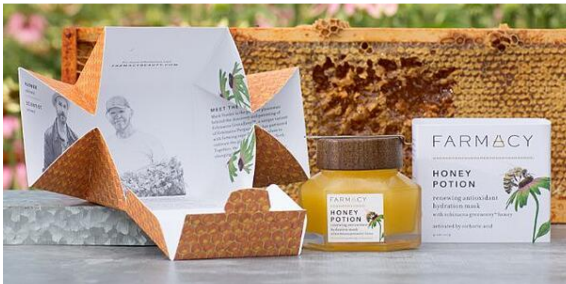
Slika 8: Primjer održive ambalaže tvrtke Natural Farmacy

Kao drugi primjer može se navesti kompanija za proizvodnju prirodne kozmetike - Natural Farmacy. Ista je osvojila nekoliko nagrada za svoju kutiju koja je inspirirana ključnim sastojkom proizvoda - medom. Šesterokutni dizajn podsjeća na saće i otvara se poput cvijeta, cijela kutija je napravljena od jednog komada kartona, što olakšava da se kasnije lako spljošti i reciklira. Također, umjesto dodavanja umetka s informacijama brenda, priča o brendu je tiskana u unutrašnjosti kutije.