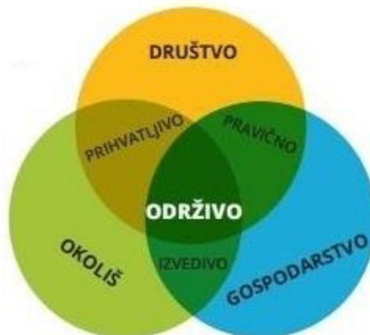
Slika 1: Stupovi održivog razvoja

Cilj održivog razvoja je trojak. On teži gospodarskoj učinkovitosti (ekonomskom razvoju) , društvenoj odgovornosti (socijalnom napretku) i zaštiti okoliša . Tri prethodno navedene stavke se još popularno nazivaju i stupovima održivog razvoja.