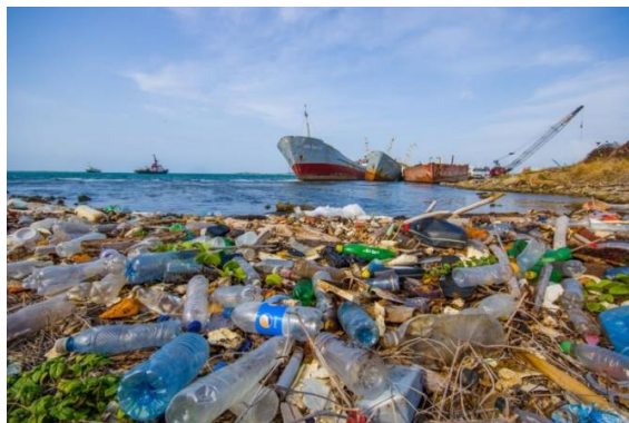
Slika 3: Plastika u oceanu

Svijest se počinje mijenjati nakon tzv. „Plavog efekta planete“. Znanstvenici i stručnjaci tvrde kako je pitanje plastike poznato već duže vrijeme, no široj javnosti nije bilo poznato koliko plastike ima u oceanima, niti koliki je njezin utjecaj na morski svijet. Premijerno prikazana 2001. godine, BBC-jeva dokumentarna serija Blue Planet otkrila je zabrinjavajuću stvarnost zagađenja naših oceana plastikom, te prvi puta postavila to pitanje u javnosti. Nakon toga izašao je Blue Planet II , također BBC-jev dokumentarac, emitiran 2018. godine koji je bio veliki hit i katalizator u osvješćivanju javnosti o zagađenju našeg okoliša.