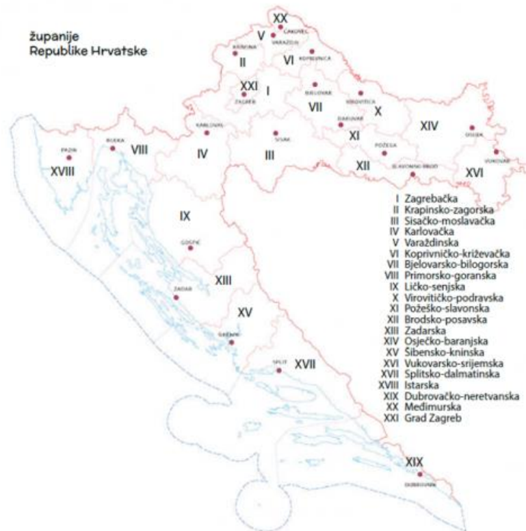
Slika 1 Karta županija Republike Hrvatske

Prema Ustavu RH županija je jedinica regionalne samouprave kojoj je područje prometna, gospodarska, društvena, prirodna cjelina i dr. Županija je teritorijalna i upravna jedinica, a osniva se zbog izvršavanja poslova od regionalnog interesa. Ima predstavničko tijelo koje građani biraju izravno za razdoblje od 4 godine, županijsku skupštinu. Izvršnu vlast u županiji obnašaju župan i zamjenici župana.