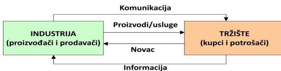
Slika 1. Jednostavni marketinški sustav

Tržište se definira kao skup kupaca i prodavatelja, drugim riječima, potrošača i prodavača. Kupci i prodavatelji komuniciraju kroz proizvode i usluge. Kao što se vidi na slici 2., jednostavan tržišni sustav koji definiraju Kotler i Keller (2016) sastoji se od industrije (proizvođači i prodavači) i tržišta (kupci i potrošači), između kojega postoji neprekidan protok proizvoda, usluga, informacija, komunikacije te novca. Ako se ovaj marketinški sustav gleda s aspekta društvenih mreža i platformi, može se zaključiti da su informacije tamo gdje je samo oglašavanje, točnije „prostor“ gdje poduzeća svojim porukama, reklamama ili preko trećih osoba (influencera) komuniciraju s potrošačem. Komunikacija u ovom slučaju predstavlja mjesto, „prostor“ na kojem potrošač daje povratnu informaciju i recenzira proizvod ili uslugu organizaciji (industriji-proizvođaču ili prodavaču). Tržište iziskuje sve veću potrebu za influencerima čija je uloga informirati i direktno komunicirati s potrošačem, te na taj način predstaviti proizvod ili uslugu i uvjeriti potrošača da mu je taj proizvod prijeko potreban. Ne žele se potpuno izbrisati neki od klasičnijih načina oglašavanja, poput televizije, radija, novina ili magazina, međutim, s povećanjem utjecaja i broja korisnika društvenih mreža i digitalnih medija, poduzeća imaju sve veću potrebu koristiti vanjske suradnike, u ovom slučaju influencere kako bi stvorili svijest o proizvodu ili usluzi.