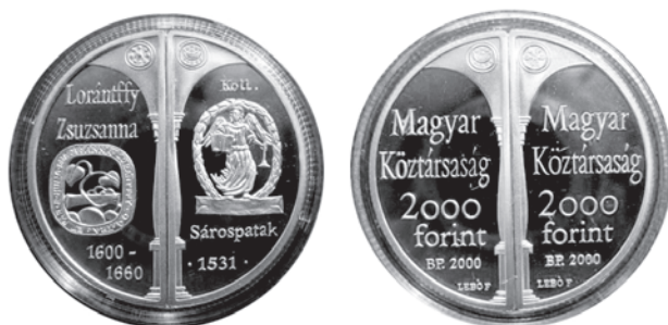
Slika 1. 2000 forinti + 2000 forinti, 2000. godina, avers i revers