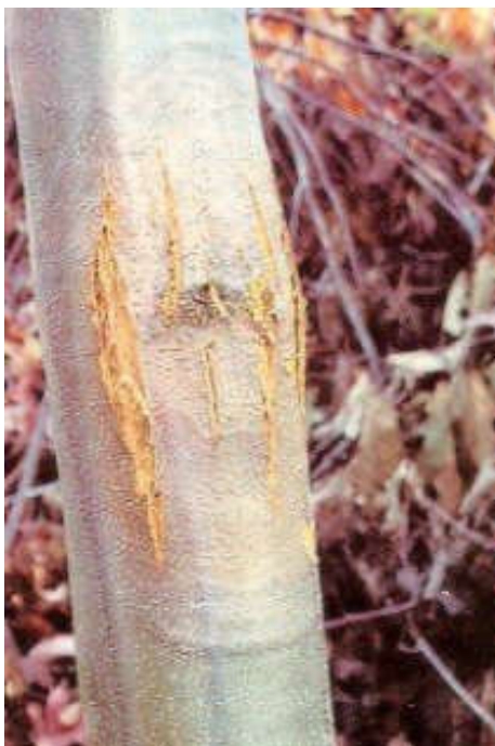
Slika 4. Rak kore pitomog kestena (Web 4)