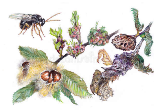
Slika 13. Ilustracija ose šiškarice, pupova i napuštenih šiški (Web 12)

Osa šiškarica svojim napadom na pitomi kesten dovodi do smanjenja lisnih površina zbog prisutnosti šiški, a time i do onemogućavanja rasta izbojaka (Slika 13). U konačnici dolazi i do smanjenja količine uroda i to 50 – 70%. Ukoliko dođe do napada na mladu biljku, može doći i do njenog ugibanja. Šiške također smanjuju fotosintetsku površinu i nakon višegodišnjih napada smanjuje se vitalnost samih stabala (Matošević i sur. 2010).