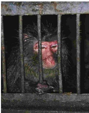
Slika 6. Bolesni siamang ( Symphalangus syndactylus ) u Zigong zoološkom vrtu, NR Kina

Stanje u kojima se životinje mogu pronaći u nekim zoološkim vrtovima je jednostavno zaprepašujuće, jer su skućeni u prostor jedva dvostruko veći od njih samih (Slika 6). Nedostatak prostora se posebno vidi kod oceanarija s kitovima i dupinima, ili pak u zabavnim parkovima gdje se životinje okome na ljude zbog malo prostora.