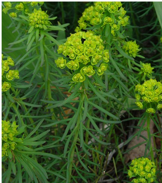
Slika 7. Euphorbia cyparissias L.

Uskolisna mlječika je zeljasta biljka, s uspravnom, razgranjenom stabljikom koja može narasti i do 20 cm u visinu. Listovi na stabljici su gusto raspoređeni i linealnog su oblika. Cvjetovi su neugledni. Po jedan ženski i više muških cvjetova razvijaju se u zajedničkom ovoju i čine cvat – cijatij (Domac, 1989; Moore, 2009).