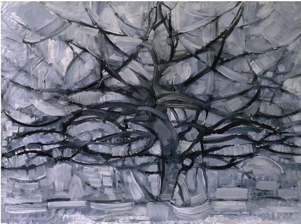
Slika 13, Piet Mondrian „Grey Tree“, 1911.

Nizozemski slikar Piet Mondrian apstraktni je slikar koji se razvio od pejzažnih slika do geometrijskih apstrakcija. 1914. razvio je apstraktni stil koristeći tri osnovne boje s okomitim i vodoravnim linijama. Njegova „Grey Tree“ uljana slika nastala je 1911. godine u vrijeme kada započinje eksperimente sa kubizmom. Ostavlja formu drveta, ali ga stilizira u svome stilu.