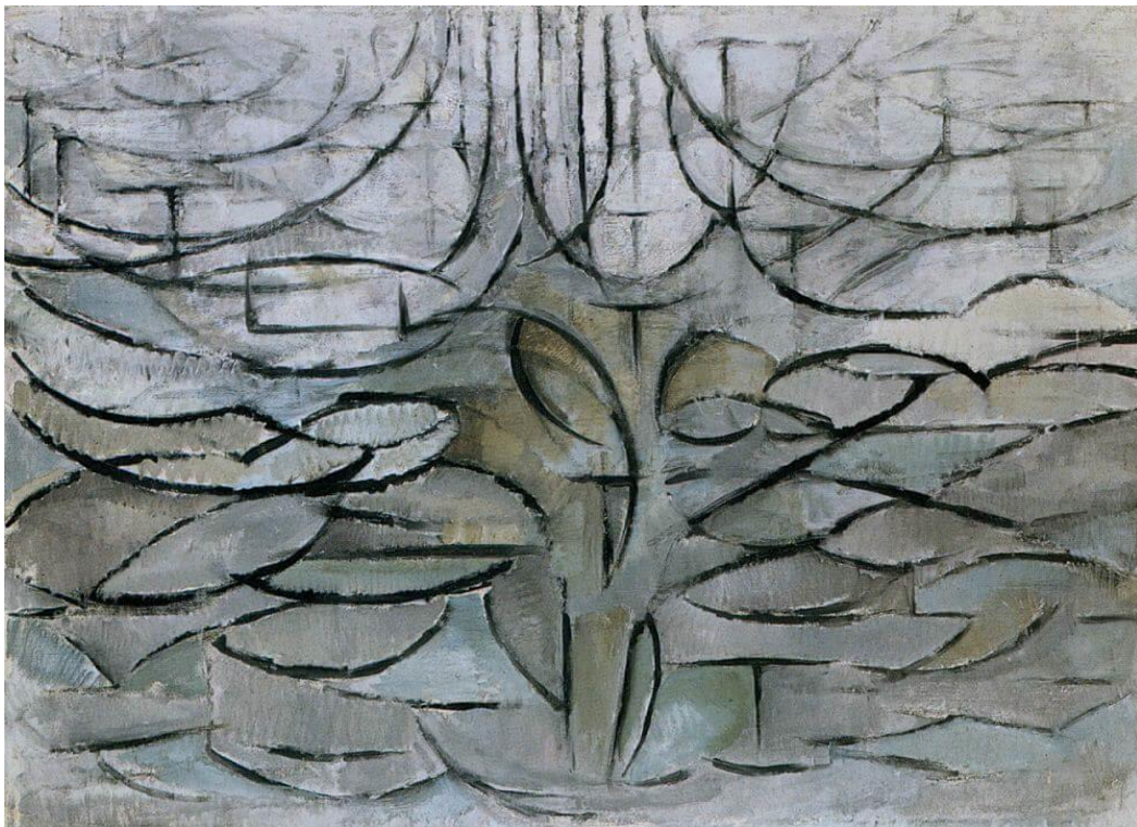
Slika 14, Piet Mondrian „Blooming Apple Tree“, 1912.

Mondrianovo djelo „The Flowering Apple Tree“ primjer je naglašene stilizacije gdje se gubi sva forma prikaza u ovom slučaju stabla jabuke. Rad je izložen u Nizozemskom muzeju Kunstmuseum Den Haag. Korištena je forma elipse kroz cijelo djelo koje se ponavljaju, a boje su jedva izražene. Dakle cilj nije preslikati postojanu formu iz prirode već je je ovdje riječ o umjetničkoj interpretaciji i njegovom viđenju stabla jabuke. To svakako mogu povezati sa završnim radom i stiliziranim minimalnim pokretima okomitih linija koje u suštini stvaraju prikaz odraza drveća na rijeci koja teče.