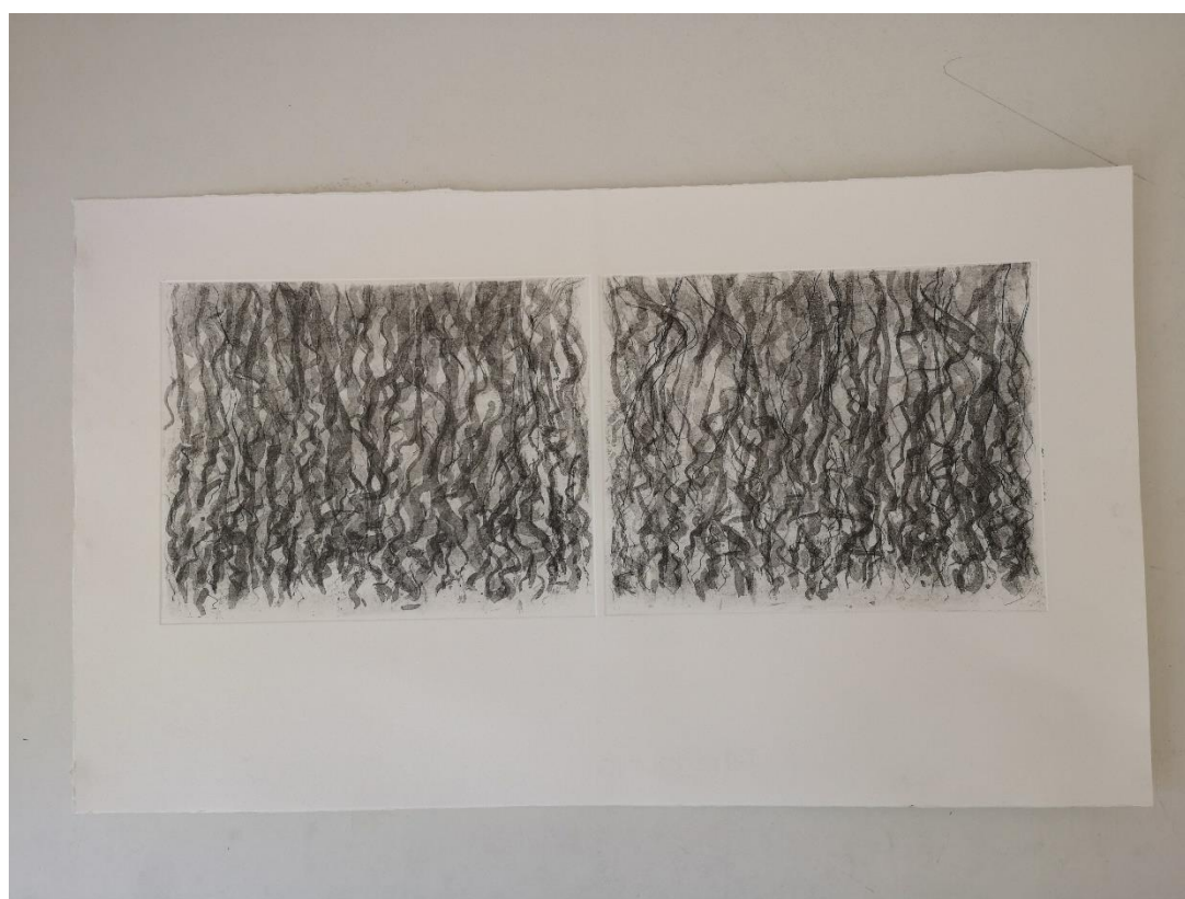
Slika 12, treći otisak (matrice pet i šest)