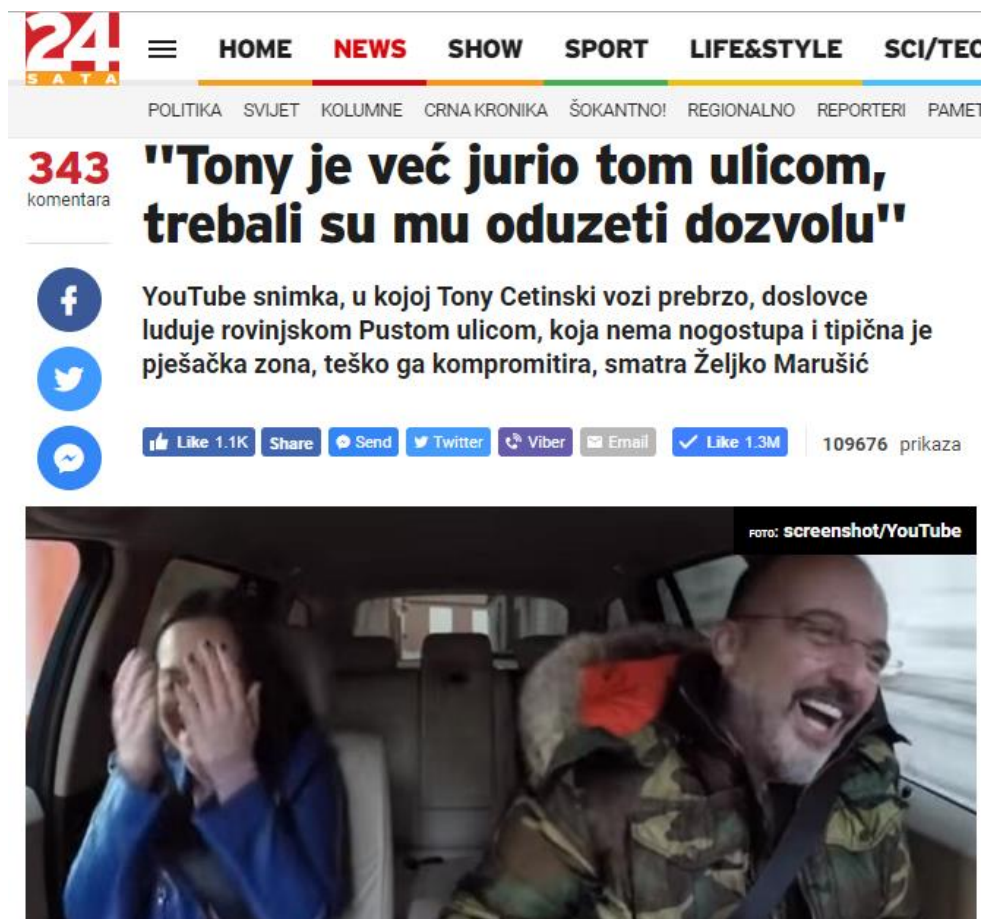
Slika br. 2 članak o prebrzoj vožnji za potrebe snimanja zabavne emisije Tonyja Cetinskog (24 sata.hr, 4.11.2017.)

Mnoge javne osobe smatraju da vrlo dobro barataju u odnosima s javnošću zbog svoje otvorenosti no upravo u kriznim situacijama zaboravljaju na tu otvorenost koja je ključni dio dobrog kriznog komuniciranja te se zatvaraju u sebe ili sa medijima komuniciraju malo ili uopće ne što izaziva izravne i veće posljedice na sliku i status javne osobe u medijima.