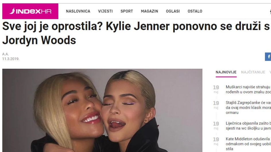
Slika br.7 Kyle i Jordyn pomirene

Khloe Kardahian u ovoj situaciji poslužila se strategijom javnog sažaljenja, ali javnosti prema njoj i strategijom korektivnih aktivnosti. Osim što je postala majka, u medijima se o njoj razvila slika i kao majke – heroja koja preživljava preljub partnera, oprašta ga, a zatim ponovno ostaje povrijeđena i to u još goroj situaciji. Khloe je strategijom korektivnog ponašanja pokušala spriječiti problem, popraviti štetu te krenuti dalje što joj je i uspjelo. Izjavama u medijima, izgledom i postupcima slala je poruku kako njen karakter javne osobe nije poljuljan.