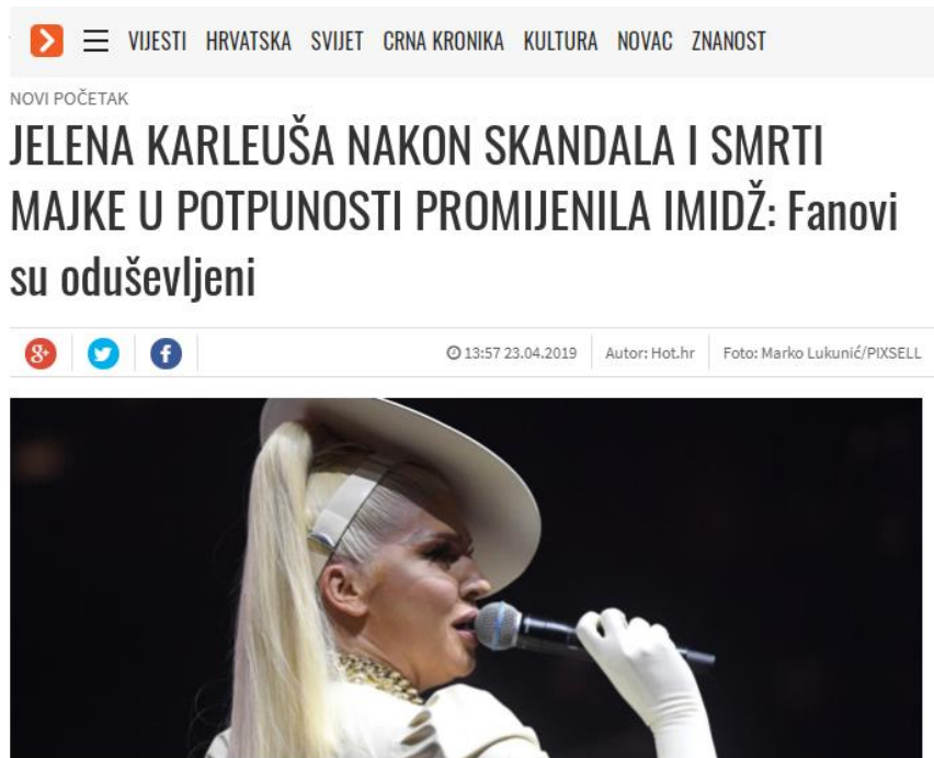
Slika br. 5 Jelena Karleuša promijenila imidž (Net.hr, 23.4.2019.)

kao moralna pobjednica. Iako je nedugo za tim izgubila i majku, pjevačica dobro balansira svojim privatno – javnim životom.