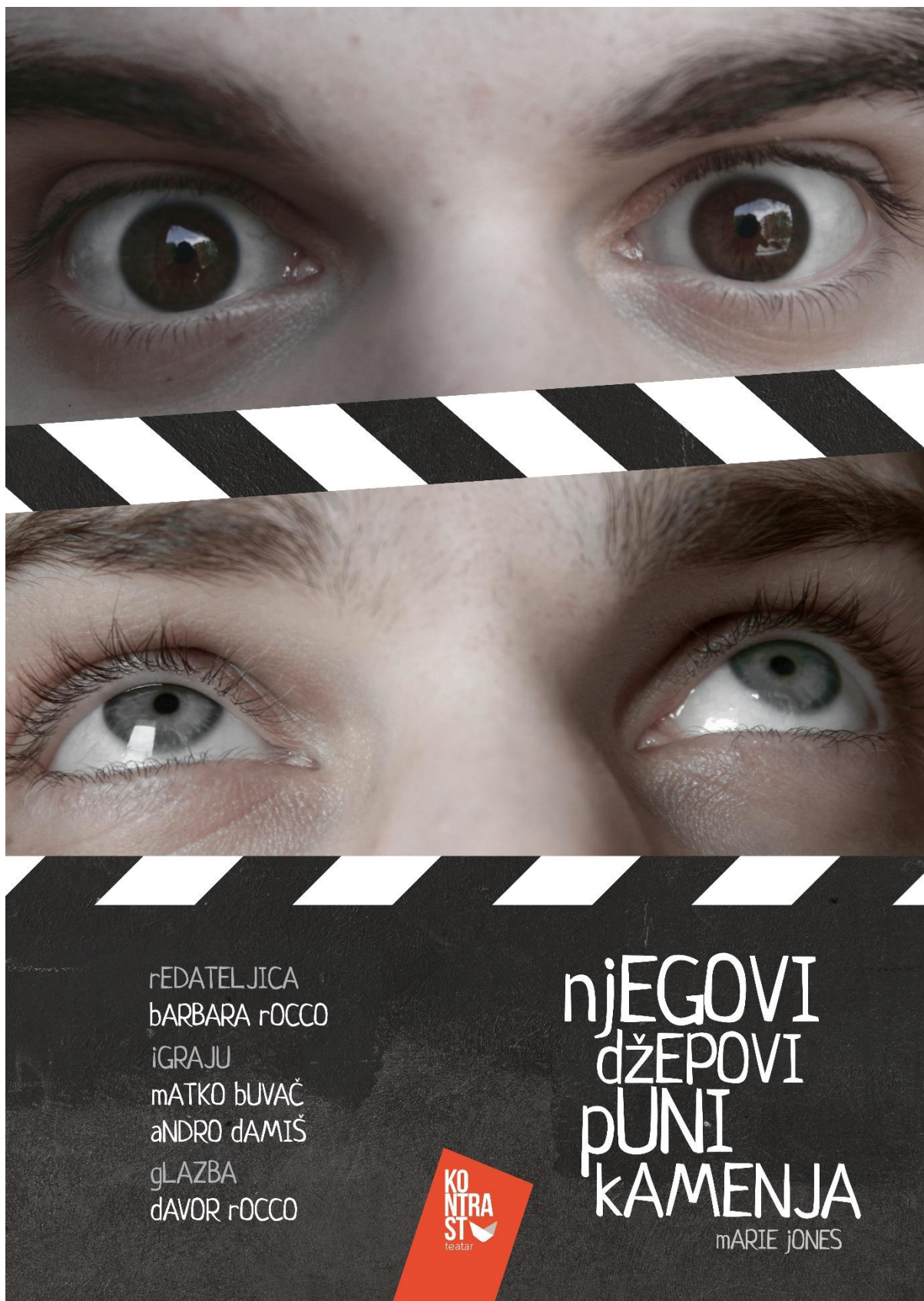
Slika 1: Plakat predstave Njegovi džepovi puni kamenja