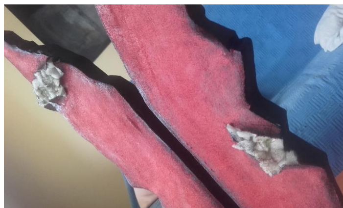
Slika IX. Brušena koža u kombinaciji sa spužvom

Da bi se ruke mogle na praktičan način animirati stavila sam vodilice izrađene od tipla. Dodavanjem šarke i vodilice dobila sam na fleksibilnosti i pokretljivosti. Kad se rukohvat stolca animira imamo dojam živog lika koje može izraziti emociju, dohvaćati stvari, zarobiti Lovorku...Naslonjač je modeliran u stiroduru te je preko njega zalijepljena crvena brušena koža (Slika IX.).