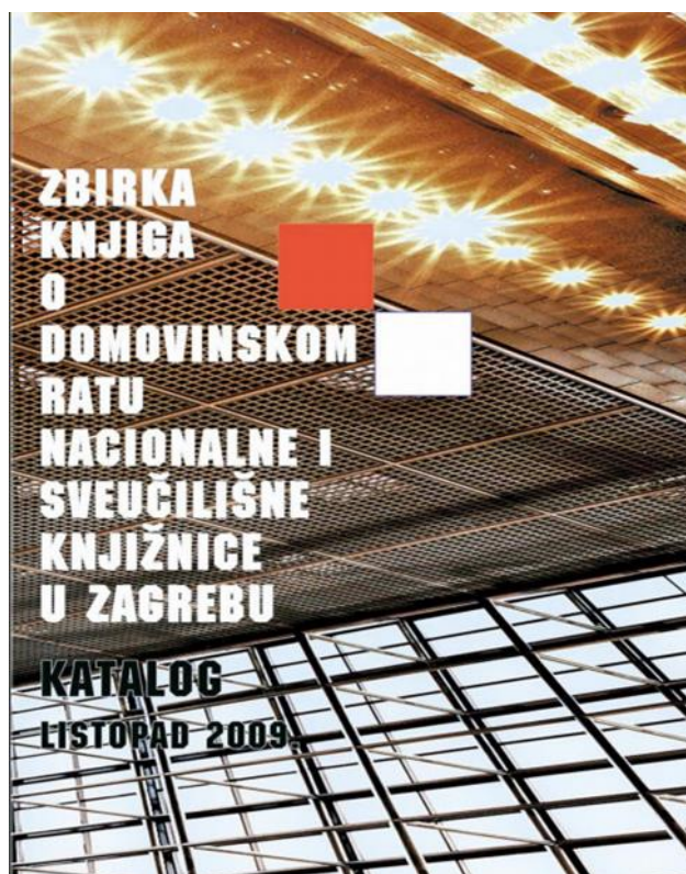
Slika 5. Zbirka knjiga o Domovinskom ratu Nacionalne i sveučilišne knjižnice u Zagrebu

Maštrović (2014:95) navodi kako su u čitaonici gdje je smještena Zbirka knjiga o Domovinskom ratu izloženi samo oni primjerci građe koji ne pripadaju u obvezne primjerke nacionalne zbirke knjiga Croatice koji se još nazivaju „arhivci“. Autor tvrdi kako je to u skladu sa stručnim i zakonskim zadaćama Knjižnice u zaštiti temeljnog fonda nacionalnog knjižničkog gradiva, koji se još naziva i nacionalnom memorijom.