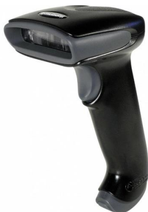
Slika 1. Ručni skener

Kod odabira uređaja za digitalizaciju ustanova mora se brinuti o svojim resursima te o tome kakvu će građu digitalizirati. O ulozi digitalizacije u Smjernicama za odabir građe za digitalizaciju (2007:16) definirano je da u obavljanju osnovnih funkcija ustanove i o planiranome opsegu ovisi odluka o tome hoće li se digitalne preslike izrađivati u samoj ustanovi, što bi podrazumijevalo nabavu potrebne opreme i osiguranje osoblja koje će njome raditi. Tekstualna i slikovna građa digitalizira se skenerima i fotoaparatom. Skeneri se dijele u dvije skupine: koračne i protočne. Prema Janeš (2003:101), kod odabira skenera treba obratiti pozornost na optičku rezoluciju, dubinu boje, vrstu konektora koji utječe na brzinu skeniranja i dimenzije. Koračni skeneri mogu samostalno skenirati građu samo ako se radi o pojedinačnoj građi postavljenoj za skeniranje. Stančić (2009:34) je podijelio skenere na ručne, plošne, skenere za mikrooblike, rotacione, 3D skenere i skenere za knjige. Ručni skeneri sliku stvaraju prelaženjem preko građe. Za rukovanje njima potrebno je konstantno i jednolično pomicanje skenera, pri čemu je mirna ruka od presudnog značenja. Ovi skeneri daju relativno loše rezultate kada je riječ o boji.