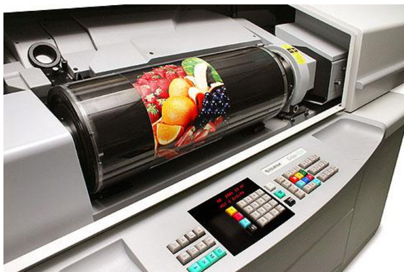
Slika 3. Rotacioni skener

Profesionalni studiji za digitalizaciju, prema Stančiću (2009:37), većinom koriste rotacione skenere koji daju sliku visoke kvalitete. Ovom vrstom skenera moguće je skeniranje isključivo one građe koja se nalazi u zasebnim savitljivim listovima ili na dijapozitivima i negativima. Prije korištenja ovim skenerima potrebno je zatražiti mišljenje osobe koja je zadužena za zaštitu građe.