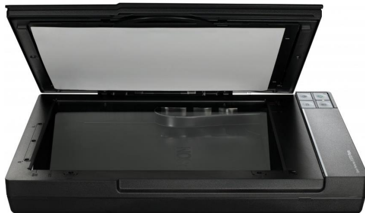
Slika 2. Plošni skener

Plošni skeneri ili stolni, reflektivni skeneri najčešće su korišteni kod digitalizacije građe. Prema Stančiću (2009:34-35), plošni skeneri uspješno skeniraju sve vrste dvodimenzionalnih plosnatih predmeta kao što su dokumenti, fotografije, crteži i grafike, knjige, umjetnička djela te blago trodimenzionalne predmete poput novčića, nakita i drugo. Zbog male veličine izvornika plošni skener postiže manju rezoluciju što daje rezultat slike s nižom kvalitetom. Postoje A4 i A3 modeli plošnog skenera koji su jeftini te se njima može jednostavno rukovati, dok su veći modeli do A0 formata skupi i isplate se jedino u dugoročnim projektima.