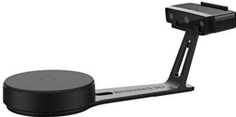
Slika 4. 3D skener

Nekontaktni 3D skener Stančić (2009:29) dijeli na aktivne i pasivne skenere. Aktivni skeneri emitiraju zračenje ili svjetlo kao što je laser te tako detektiraju odraz predmeta. Laseri koji se koriste moraju imati malu snagu kako ne bi oštetili površinu objekta. Pasivni nekontaktni 3D skener može biti digitalni fotoaparati koji izrađuju niz uzastopnih fotografija koje se kasnije u računalu analiziraju i daju 3D model. 2