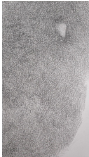
Slika 3. i 4. Postavljanje osnovnih tonova i kompozicijskih elemenata