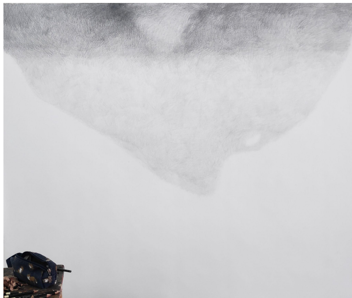
Slika 5. i 6. Postavljanje osnovnih tonova i kompozicijskih elemenata