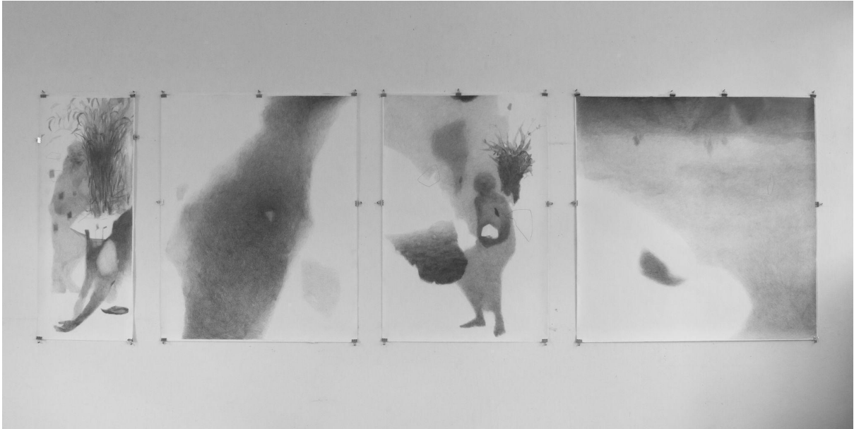
Slika 7. Serija radova „Međuprostor“

Radovi su realizirani tonskim pristupom crtežu s minimalnim linearnim elementima. Nakon prve faze postavljanja osnovnih tonova (slike 3., 4., 5. i 6.) slijedi zatamnjenje određenih fragmenata crteža u svrhu naglašavanja prostornih planova.