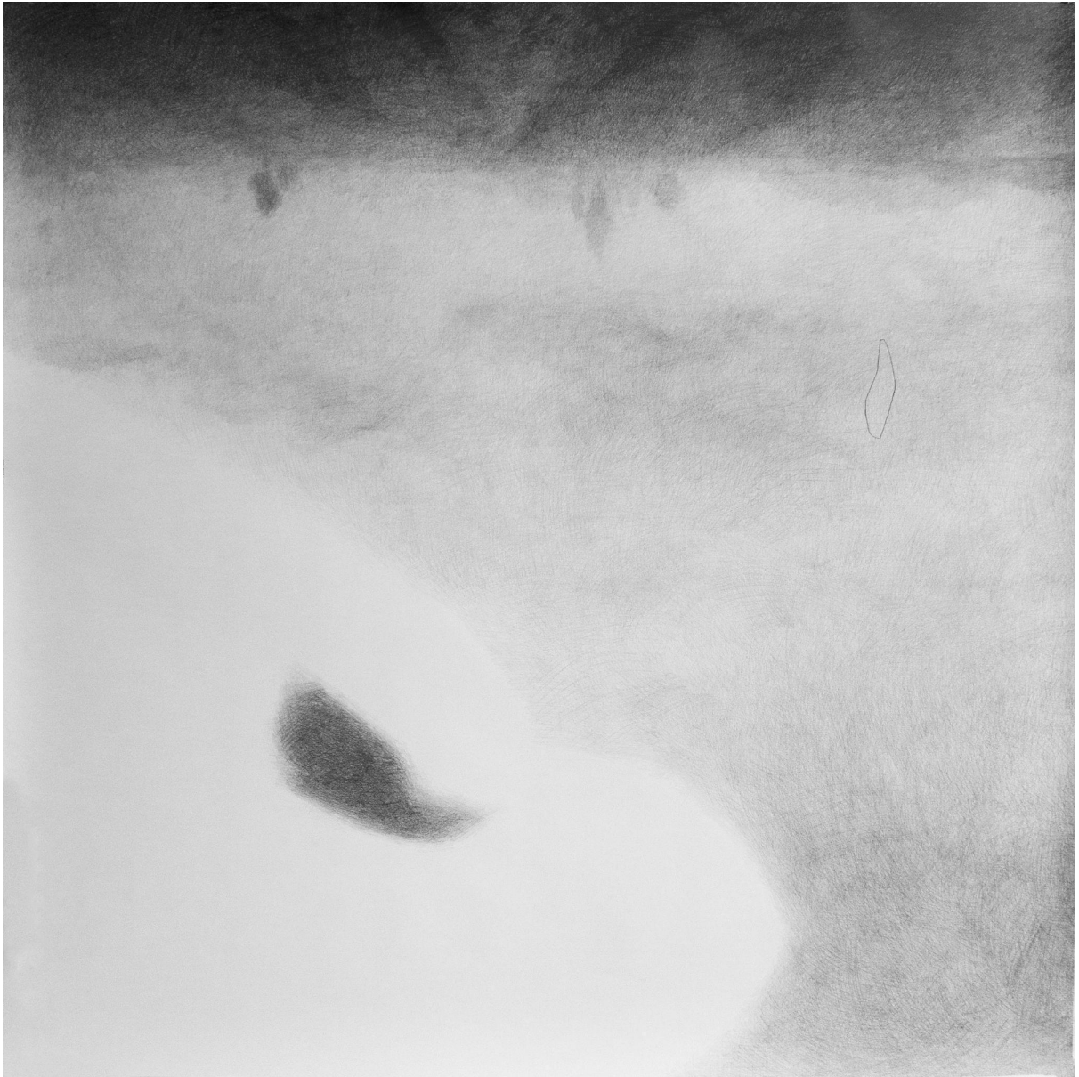
Slika 11. Četvrti crtež u seriji (četvrta faza sna)